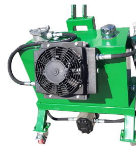
Centrale hydraulique indépendante avec refroidisseur 80l/min à 200 bars